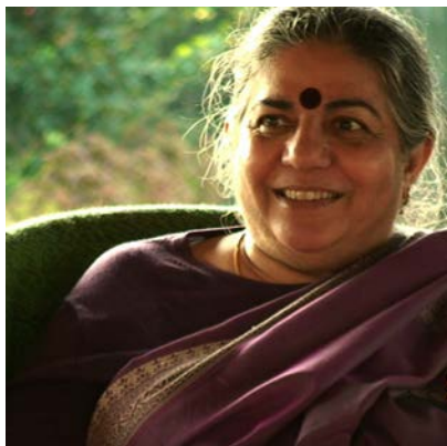
DR. VANDANA SHIVA

« Se penser comme des consommateurs fait partie du problème, retrouver notre identité de créateur et de producteur fait partie de la solution. »